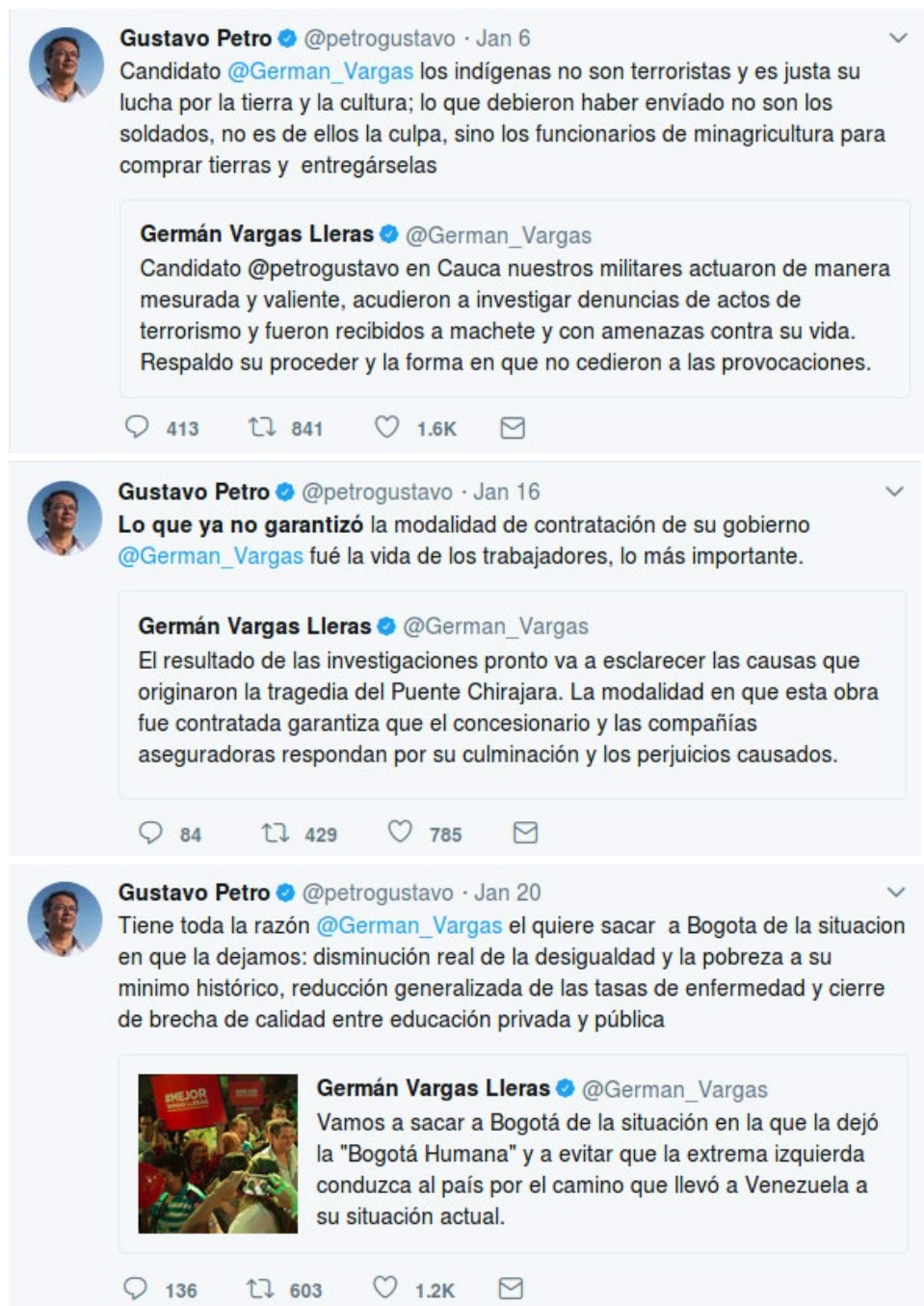
Figura 2. Algunos de los mensajes retuiteados por @petrogustavo y @German_Vargas durante enero de 2018.

Petro no deja fuera ninguna oportunidad para responderle a Vargas Lleras.