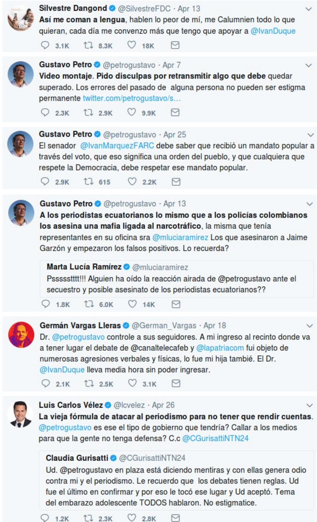
Figura 2. Tuits que han recibido el mayor número de reacciones en abril.