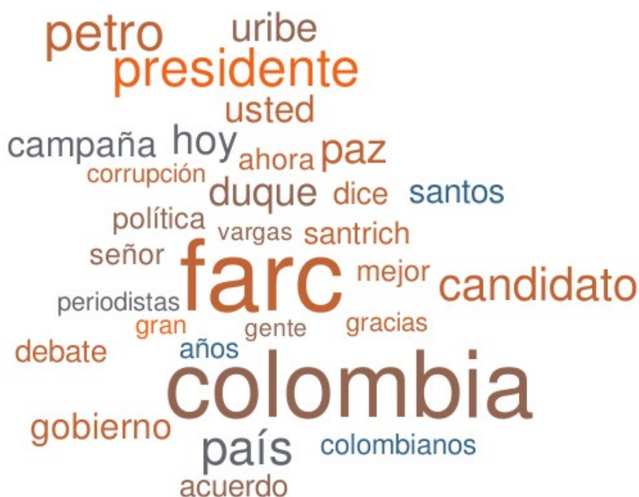
Figura 3. Unigramas más usados en Twitter en abril.

El tamaño de los unigramas es directamente proporcional a la cantidad de veces que aparece en los tuits de Abril.